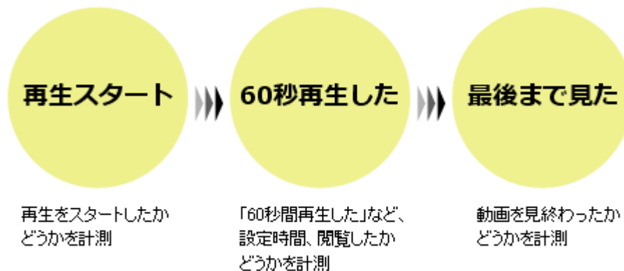
図3: 本機能で計測可能なイベント

また、動画の再生スタート、設定時間までの再生、完了の回数は、流入経路別に一覧化して見ることができます。さらに、ユーザごとに動画の再生時間も計測することも可能です。